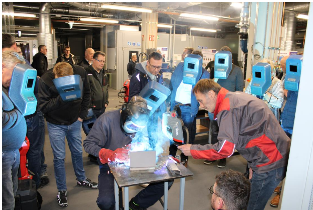
Bild 8: Vergleich zwischen normalem Lichtbogen und PMC-Lichtbogen